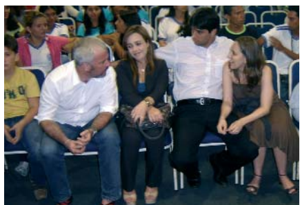
Juízes do Trabalho participaram ativamente das atividades da culminância do PTJC no RN