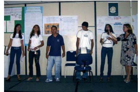
Culminância nacional reuniu trabalhos de alunos das quatro escolas participantes do Programa

O Programa Trabalho, Justiça e Cidadania