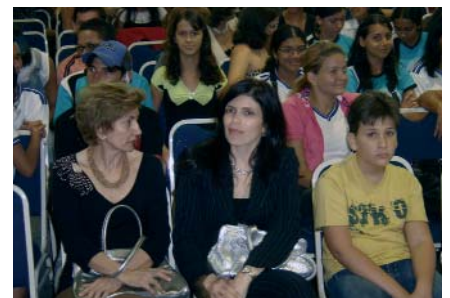
Auditório do Hotel Barreira Roxa lotado na culminância